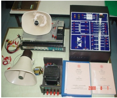
ภาพที่ 3 แสดงชุดการสอนเรื่องระบบเสียงสาธารณะ

4.1.1.3 ชุดสาธิต ประกอบด้วยชุดสาธิตระบบเสียงสาธารณะ แสดงดังภาพที่ 3