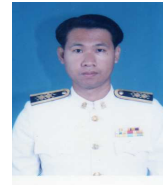
ประวัติผู้วิจัย